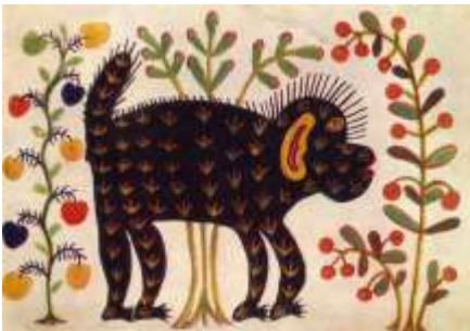
Чорна мавпа. 1936 р.

фарби. Взяла і відразу рушник намалювала. «...Листок забрали і дали другий, а я тільки краски бачу та білу-білу бумагу...» – згадувала майстриня свій перший день у Києві. Життя в Києві було зовсім не схожим на її сільське повсякдення. Тут Марія Овксентіївна відкривала для себе нові обрії. Вона засиджувалася в майстерні, її не можна було відірвати від творчої роботи. Спілкуючись із учителями та слухачами школи, вона вперше відчула себе художником і зрозуміла, що головним у її житті буде мистецтво.