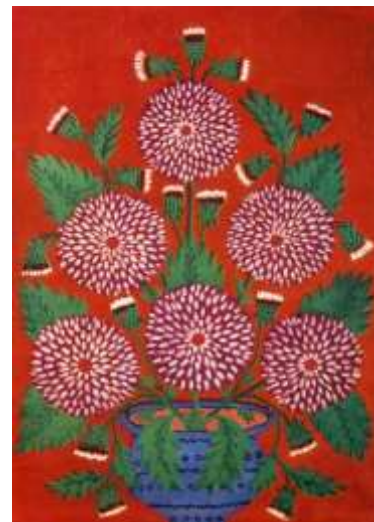
Жоржини у синій вазі. 1965