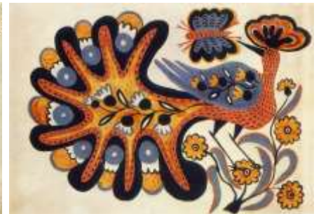
Казкова птиця-павич. 1936 р.

У ці роки Марія Примаченко створює цілу серію малюнків, яку назвала «Звірі у Болотні» (1935-1941), для яких характерне біле тло, темні