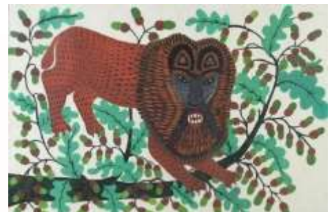
Лев зламав дуба. 1963