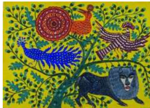
Звірі в гостях у лева. 1965