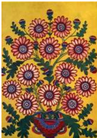
Квіти за мир. 1965