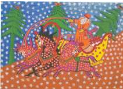
Дід Мороз везе ялинку. 1960

Замріяний, казковий погляд на життя і водночас загострене почуття реальності допомогли Марії Примаченко – простій селянці із Полісся – створити неповторні образи-символи, самотньо відобразити головні події епохи і залишити по собі чарівний світ малярства. Вона посідає одне з найпочесніших місць серед визначних майстрів-примітивістів, як французи Анрі Руссо та Анрі Матісс, грузин Ніко Піросманішвілі, хорват Іван Генераліч. Її творчість – унікальне явище у світовому мистецтві.