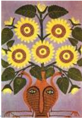
Соняшник життя. 1963

Характерна пристрасть Марії Примаченко до зображень соняшників – яскраво-жовтих кольорів з безліччю темного насіння: свого роду переосмислення якнайдавнішого знаку, по-філософськи наповнений образ сонця, родючості, вічного кровообігу життя – народження, вмирання, відродження.