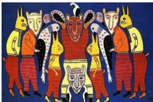
Звірячий цирк. 1977

Пащенко В. Світ Марії Приймаченко очима дітей / В. Пащенко // Голос України. — 2009. — 4 лют.