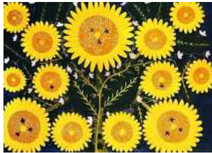
Соняшник із бджолами. 1962