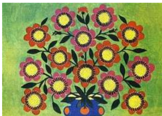
Квіти соняшника. 1965