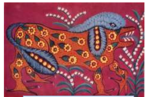
Собака - красуня. 1964