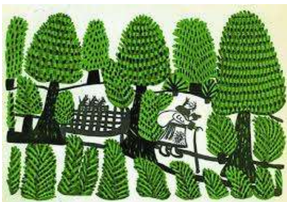
Щур у дорозі.

✚ У 2013 році розгорівся скандал щодо використання малюнків Марії Примаченко в якості реклами. Фінська компанія «Марімеikko», яка виробляє одяг і товари для дому, визнала, що один з її фабричних принтів був скопійований з робіт великої українки.