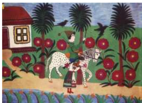
Галя і козак. 1947

Виростає кричма слово, наче півень на тину, і лякає лунко знову гомінку самотину. Перекинись карим зглядом через хмизяні дими, весняну веселість саду