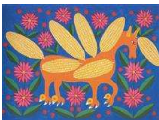
Кукурудзяний кінь у космосі. 1978

– космічна. Вона любила зоряне небо і населяла його своїми крилатими істотами – горбокониками, русалками, птахами. Навіть на Місяці вона садила городи, плекаючи свої чарівні мрії. Її дивосвіт був чарівним і неповторним, унікальним і сонцесяйним, щирим і добрим, як вона сама. Людям у цьому світі жилося гармонійно і щасливо, а поміж великих, як у раю, диво-квітів з незліченною кількістю вишуканих пелюсток блукали в своїх казкових життєвських справах розписні диво-звірі, і співали над ними витончені птахи з жіночими очима. Може, тому й лишається її світ поза часом і простором, бо від її робіт у душі накопичується оптимізм, піднімається настрій і впевненість, віра у краще майбутнє. Геніальна художниця створила власний мистецький стиль, в межах якого нескінченні варіанти декоративних, орнаментальних, жанрових і пейзажних композицій.