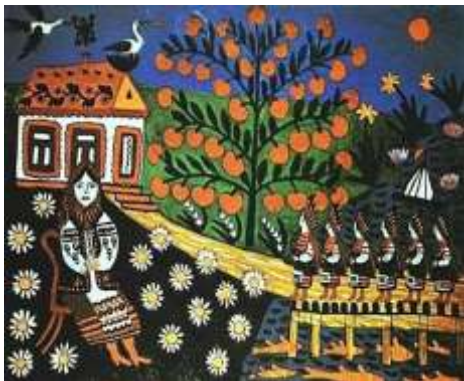
Роки мої молоді, приходіть до мене в гості. 1969