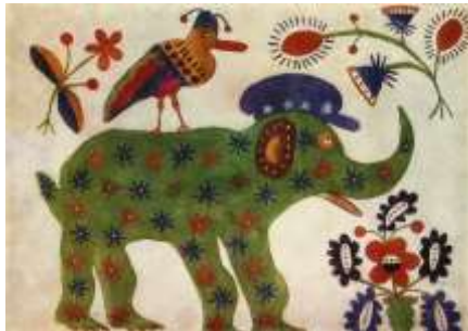
Зелений слон. 1936 р.