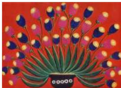
Домашні маки. 1965