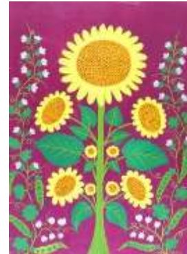
Соняшник та горох. 1962

Саме за цей цикл у 1966 році Марії Примаченко удостоєна звання лауреата Державної премії України ім. Т. Г. Шевченка. Нагороджена орденом «Знак пошани» (1960 р.). У 1970 році їй присвоєне звання заслуженого діяча мистецтв України, а у 1998 р. – почесне звання народної художниці України.