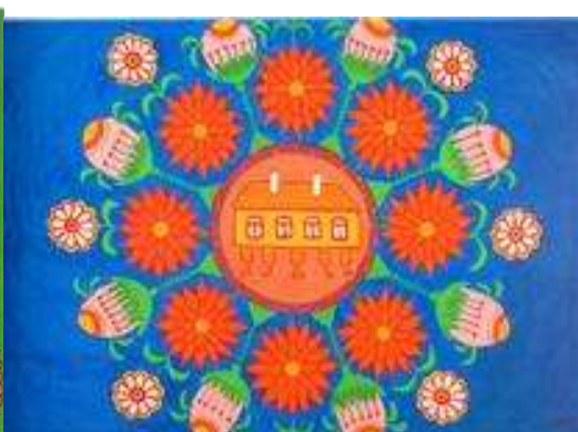
Космічна хата, у тій хаті півроку жили космічні солдати. 1978

Птахів вона малювала казковими істотами химерних форм, часто квіткоподібними, з крилами-вишиванками. Проте, у художниці вони завжди добрі, симпатичні («Захотів слоник моряком бути», «Молодий ведмідь по лісу ходить і людям зла не робить»).