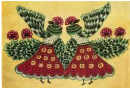
Морські артисти. 1961