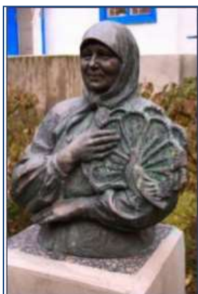
Яготинська картинна галерея