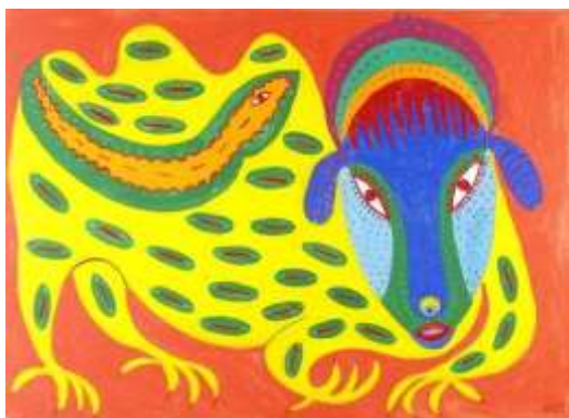
Дикий чаклун. 1977

Приймаченко (Примаченко) Марія Оксентівна // Видатні українці. Культура. Мистецтво. Освіта. Серія «Гордість і слава України» : довід. — Київ, 2016. — С. 265-270.