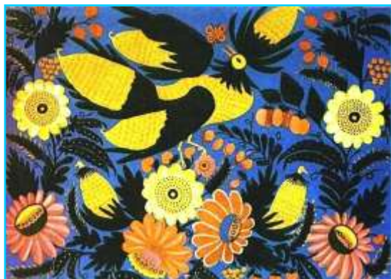
Жар-птиця в квітах. 1962

Цей звір ворожить. 1983 Цей звір п'є яд, а смочче його гад. 1982 Цей звір прибіг із гір. 1978 Ця птиця на чотири сторони дивиться. 1977 Чайки у човні. 1965 Червоні маки. 1982 Чорна мавпа. 1936 Чорний звір. 1936 Чотири п'яниці їдуть на птиці. 1976 Я з тобою, Іванко, не нажилася... 1966 Ягня вовка запрягло. 1983 Як везли ріпку дід і баба. 1983 Ялинкові квіти. 1969